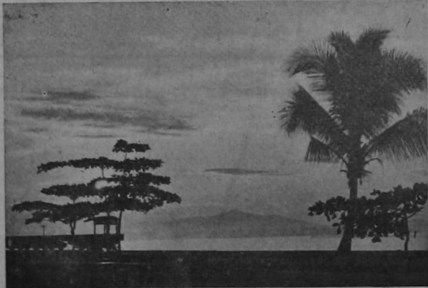
Copos de verdura sobre la inmensidad abrasada del Desierto, son las palmeras. Esta palmera nos recuerda la otra que estuvo en Barba y a la que alude nuestro artículo